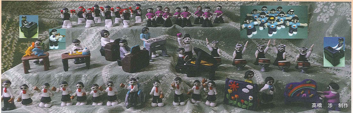
高橋 渉 制作

子どもたちの秘められた力を理解することが、彼らの自己実現と社会参加を支えます。 みなさまのご来場を心からお待ちしております。