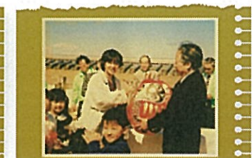
50 万人達成 平成 7 年 4 月 3 日