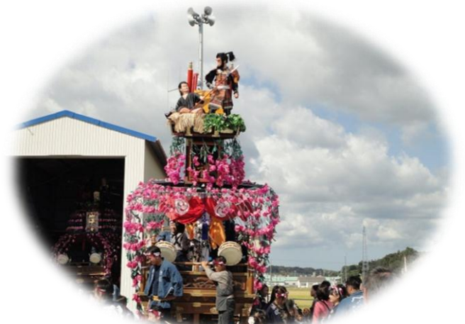
【 岩滑区 】