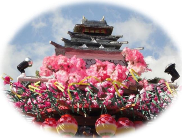
【 小貫区 】