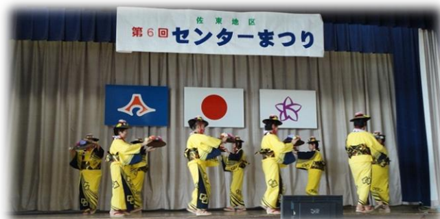
8/18 センターまつりの様子