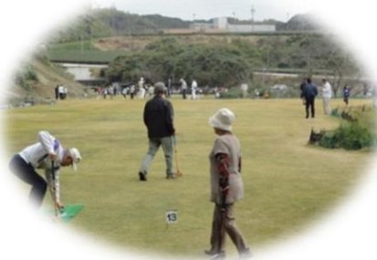
11/10 グラウンドゴルフ大会の様子