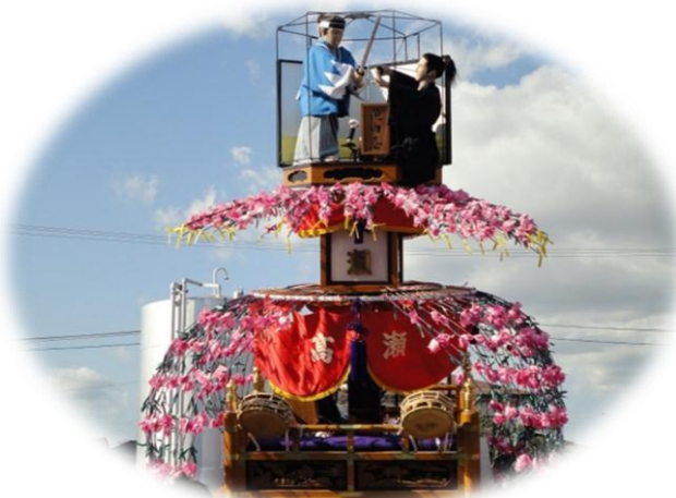
【 高瀬区 】