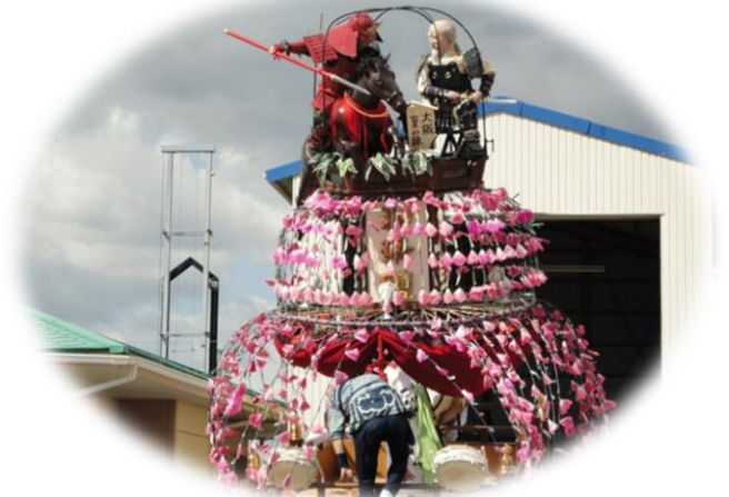
【 中方区 】