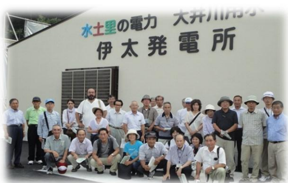
伊太水力発電所にて