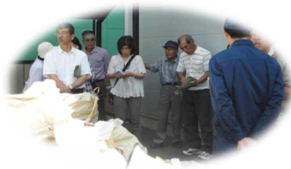
リサイクル工程見学