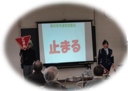
12/6 交通安全講習会の様子