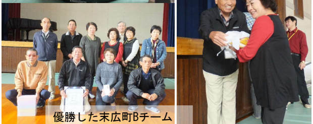
優勝した末広町Bチーム

11月6日(日)掛二小体育館において、第五地区福祉協議会・福祉部主催のスカットボール大会が開催されました。