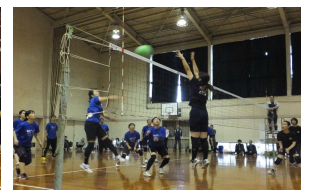
優勝した秋葉路チーム